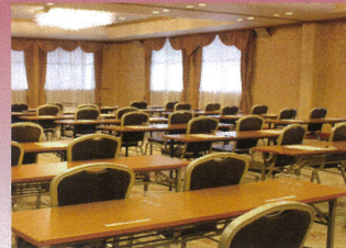
会議室一例 (学校形式)